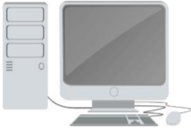
Computador de escritorio